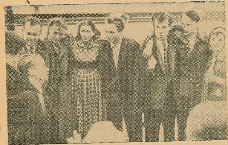
Студэнты розных краін заўсёды знаходзяць агульныя тэмы для шчырых, цікавых гутарак і аднолькава любімыя песні.

...Колькі цёплых слоў было сказана на развітаным балі, колькі песень—польскіх, беларускіх, рускіх—спета! Так сустрэкацца могуць толькі браты, людзі, якія звязаны адной справай будаўніцтва новага жыцця. Бадай, немагчыма, пераць словамі тую абстаноўку цяплін і сардэчнасці, якая акружала нас у Польшчы. Магчыма ў некаторай ступені перададуць яе ніжэй змешчаныя здымкі.