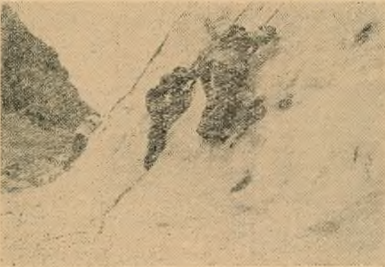
На лёдавых занятках.